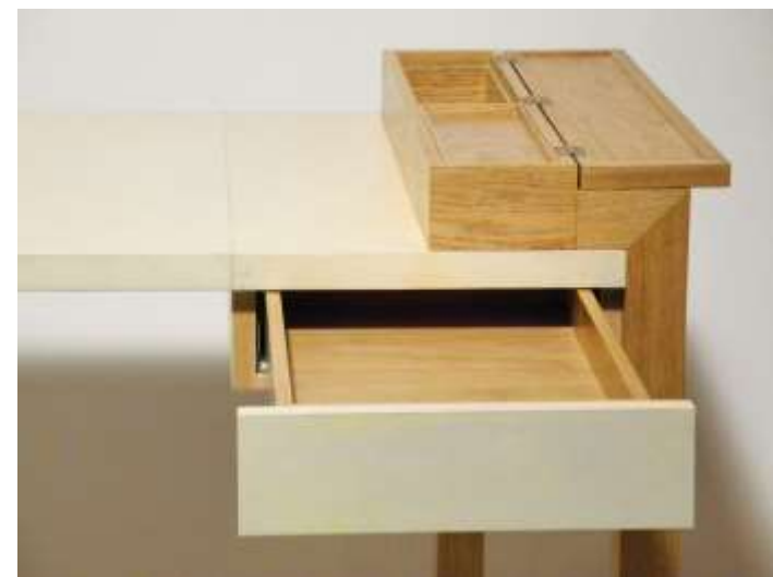
ABYDOS Bureau Chêne Parchemin - 85 x 135 x 70 Création Jérôme Cordié 2015