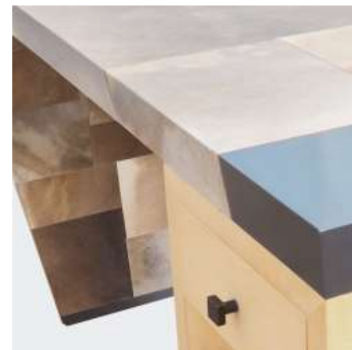
ANIEL - Bureau – Parchemin. Sycomore. Laiton canon de fusil - 130 x 620 x 750 Création Jérôme Cordié 2016