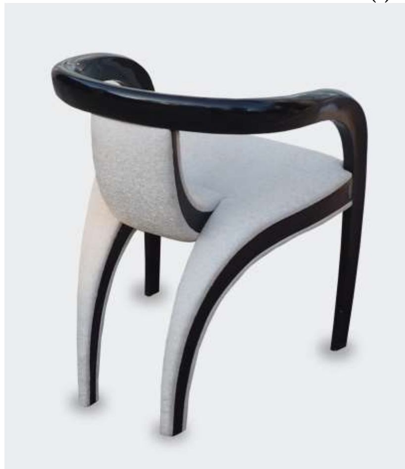
SIEGE DES ANGES - Laque noire - 64 x 50 x 80 Cr ation J r me Cordi  2004