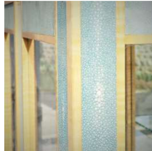
MINERVE Argentier - Galuchat bleu Galuchat argenté Sycomore - 170 x 93 x 40 Création Jérôme Cordié 1995