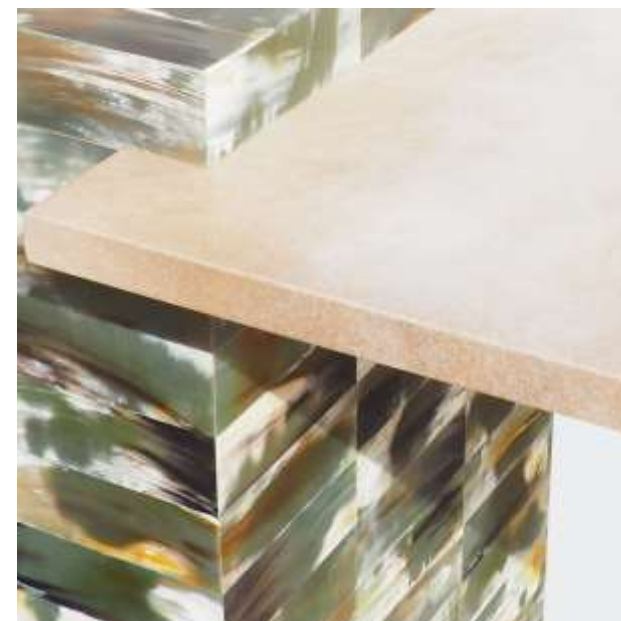
EDEN Bureau - Corne verte Parchemin antique Acier bross  - 70 x 180 x 75 Cr ation J r me Cordi  2019