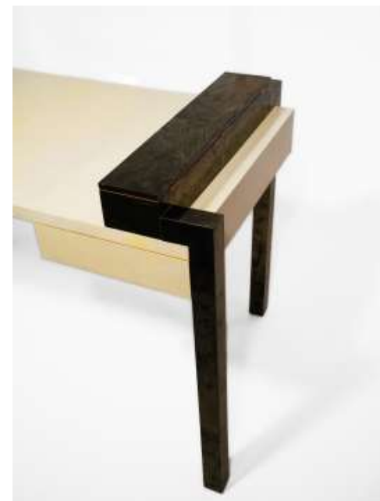
ABYDOS Bureau Chêne mica - 85 x 135 x 70 Création Jérôme Cordié 2015