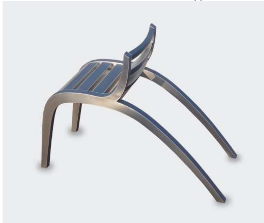
MARIE BLUE Siège - Structure Bois Aluminium Cuir bleu - 70 x 40 x 95 Création Jérôme Cordié 2016