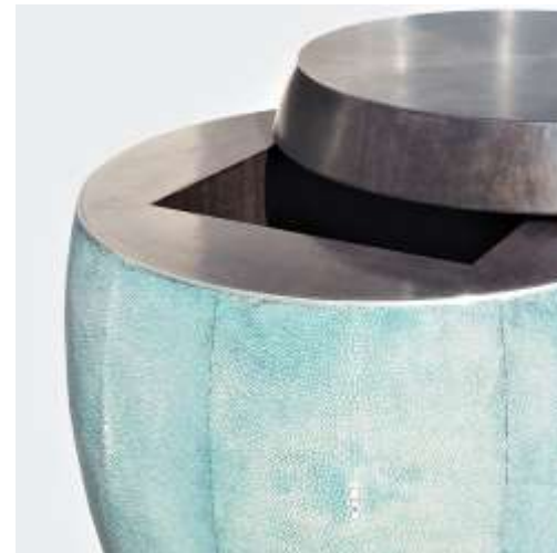
BACCHUS Tabouret - Galuchat Noyer noir filet étain - 41 x 35 Création Jérôme Cordié 2016