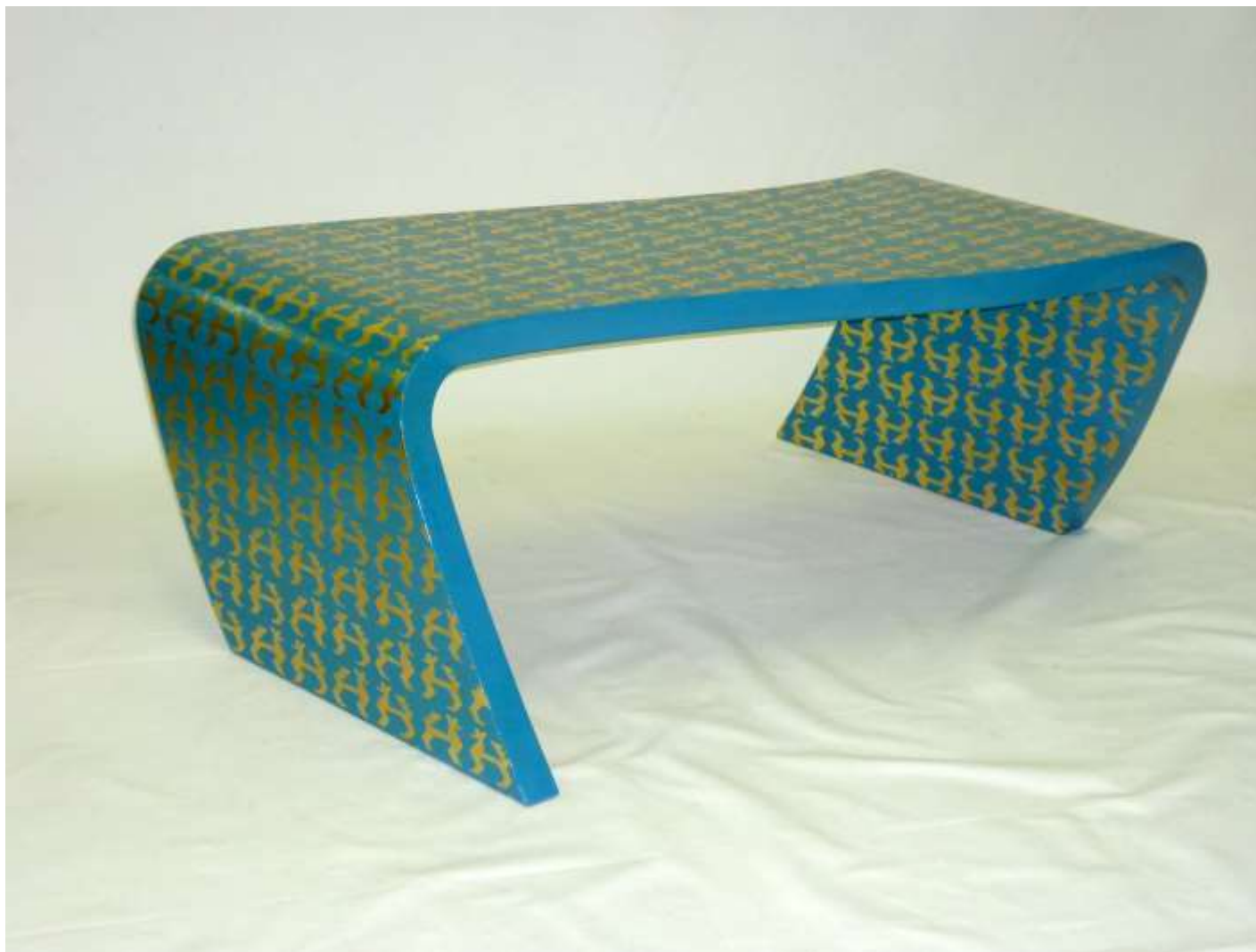
HUACA Table basse - Laque bleue Décor or - 40 x 100 x 143 Création Jérôme Cordié 2008

N° lot : 38 - Estimation (€) : 800/ 1 200