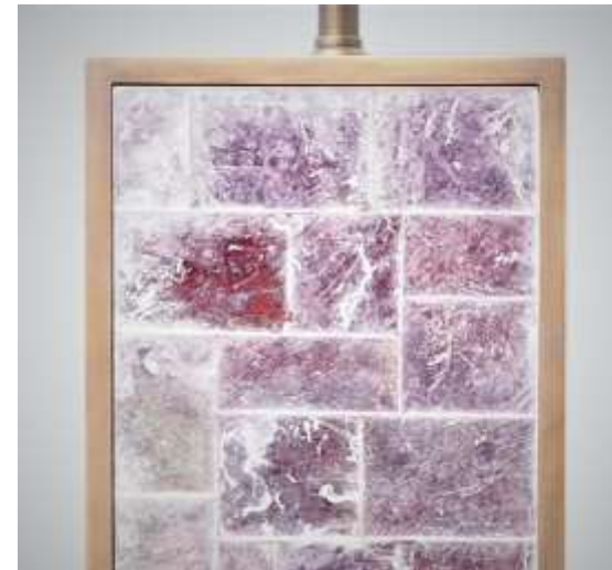
OSIRION - Lampe Mica rose Laiton - H 51 Création Jérôme Cordié 2019