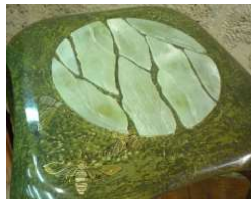
DEBURIEL - Sellette - Laque orientale aux abeilles. Jade. Fer pur - 45 x 45 x 112 Création Jérôme Cordié – bronze : Carole Crèvecoeur – décors laque : Marie de la Roussière - 2008