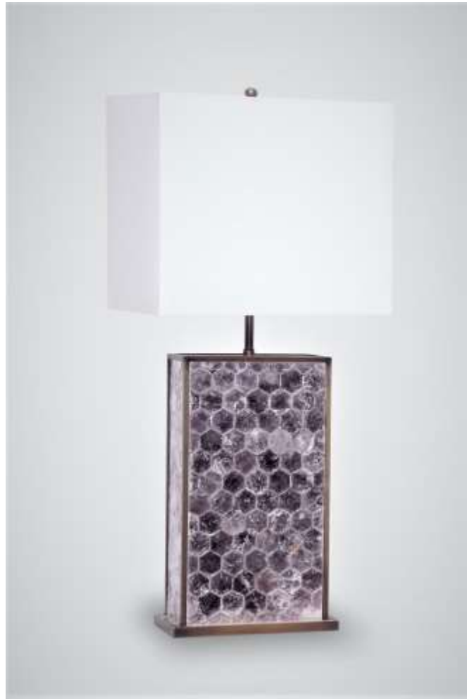
OSIRIS - Lampe Mica rose Laiton - H 76 Création Jérôme Cordié 2019

N° lot : 57 - Estimation (€) : 1 500 / 2 000