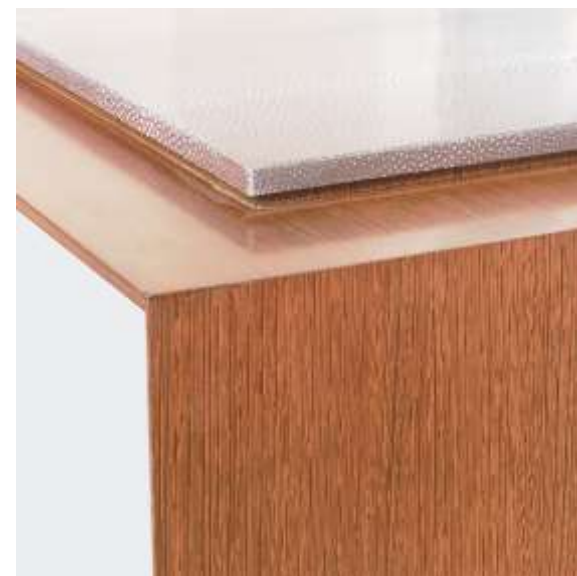
EA - Console Weng  - Cuivre Galuchat - 155 x 40 x 96 Cr ation Aisth sis - J r me Cordi  2019