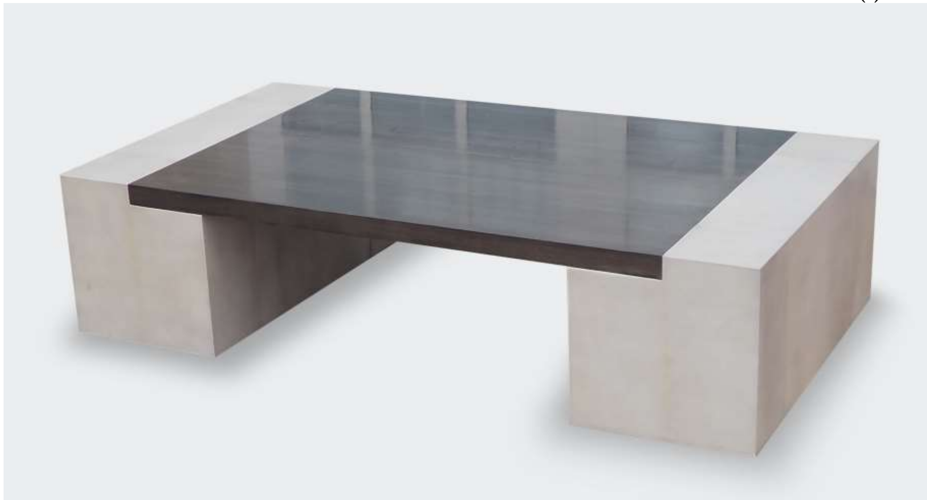
TANIS - Table basse - Noyer massif Parchemin - 93 x 170 x 40 Cr ation J r me Cordi  2016

N  lot : 51 - Estimation ( ) : 2 500 /3 000