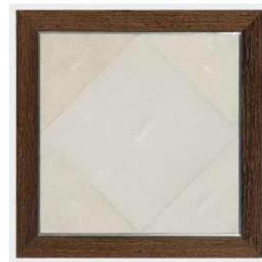
EVA - Table basse - Galuchat Wengé bronze nickelé filet étain - 49 x 50 x 50 Création Jérôme Cordié 2014