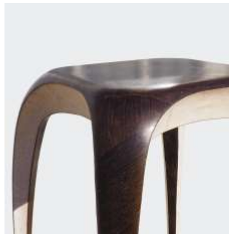
YRAGAEL - Sellette - Galuchat. Chêne lacustre Fer pur - 45 x 45 x 112 Création Jérôme Cordié – bronzes : Carole Crèvecoeur - 2008