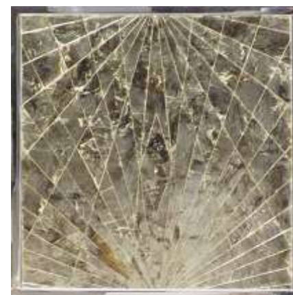
HATHOR - Cabinet - Mica. Acier inox. Or blanc sur laque noire - Bronzes argentés. Intérieurs en parchemin 160 x 730 x 140 – Création Jérôme Cordié 2014