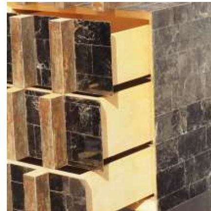
ETHER Colonne 3 tiroirs - Mica Parchemin patiné Intérieurs en amarello - 134 x 50 x 50 Création Jérôme Cordié 2012