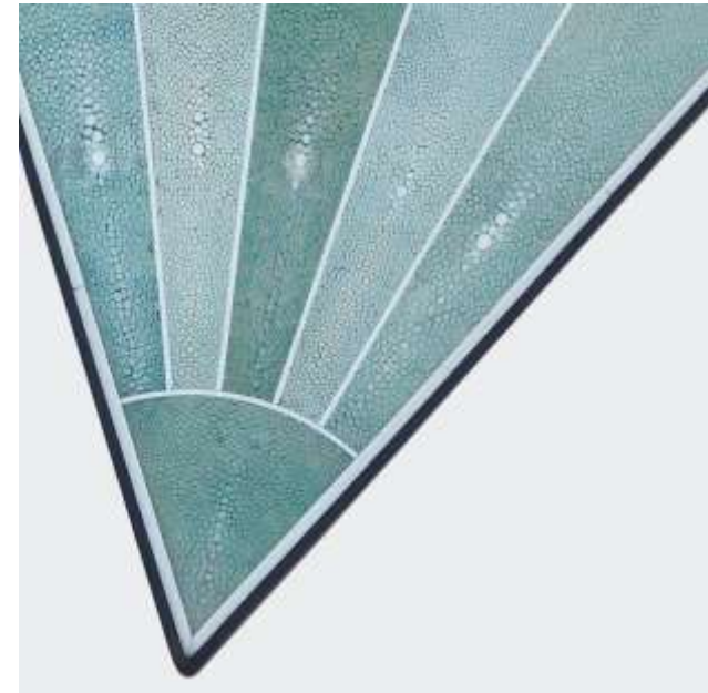
TRIOLOGIE Table basse 2 - Galuchat Ebène Os - 55 x 55 x 55 Création Jérôme Cordié 1995