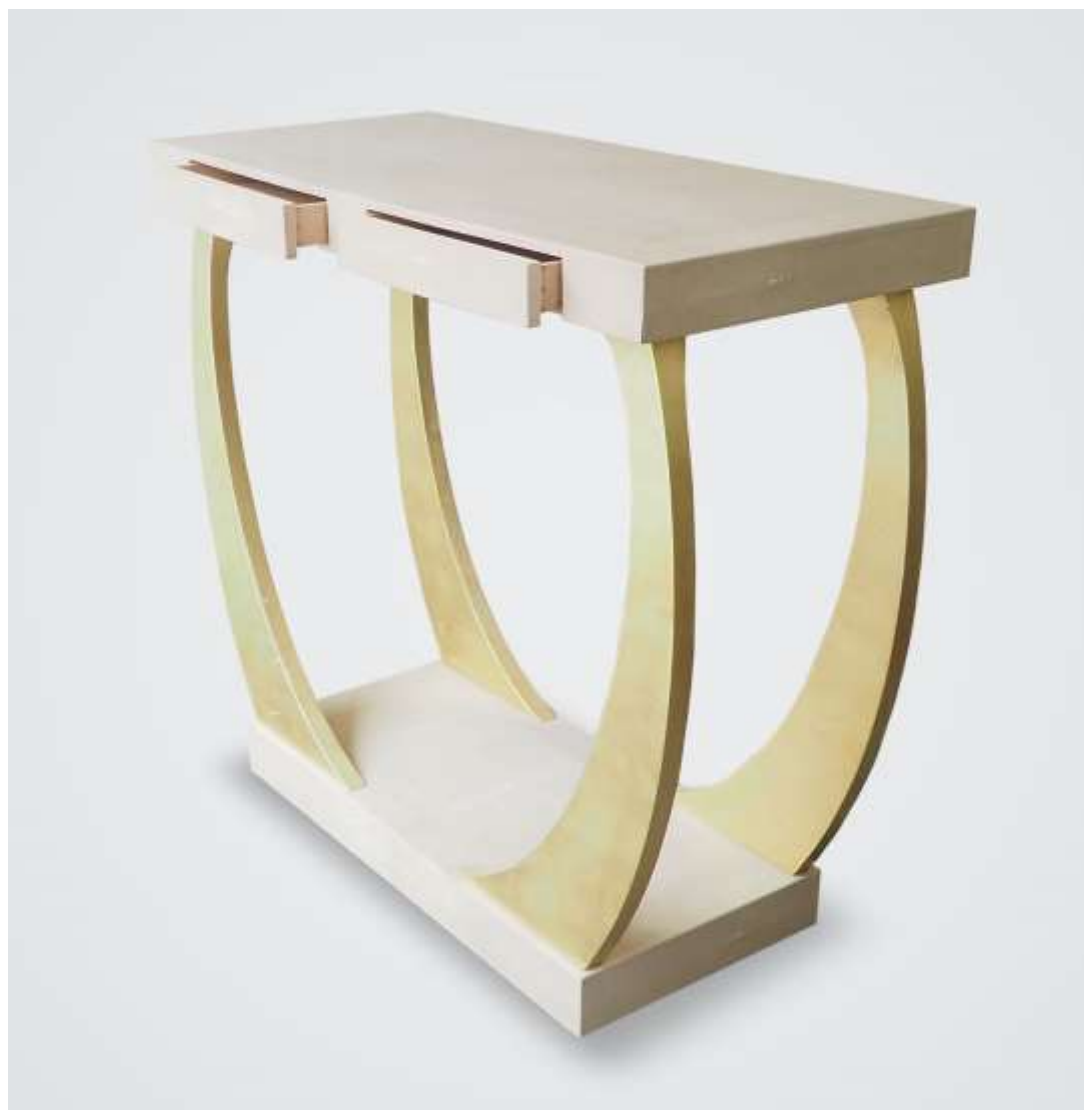
APIS Console - Or vert Galuchat vert - 89 x 97 x 43 Création Jérôme Cordié 2010

N° lot : 40 - Estimation (€) : 1 200 / 1 500