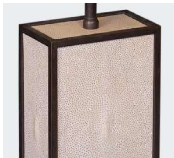
OSIRION - Lampe Laiton Galuchat - H 51 Création Jérôme Cordié 2019