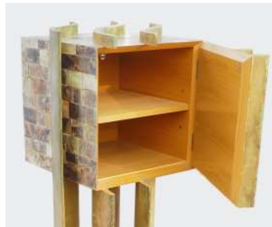
ETHER Colonne 1 porte - Mica Parchemin patiné Intérieurs en amarello - 134 x 50 x 50 Création Jérôme Cordié 2012