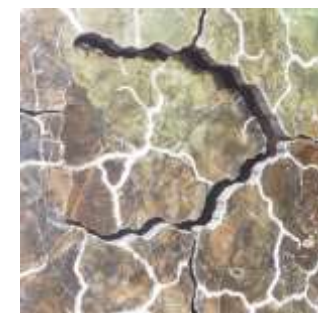
GAÏA Colonne - Mica Chêne lacustre Laque mauve Miroir plomb - 40 x 40 x 188 Création Aisthésis – Jérôme Cordié 2019