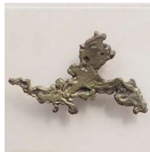
OURANOS Console - Acajou Parchemin – Bronzes : Création Jean-Etienne Azemar - 100 x 69 x 32 Création Jérôme Cordié 2002