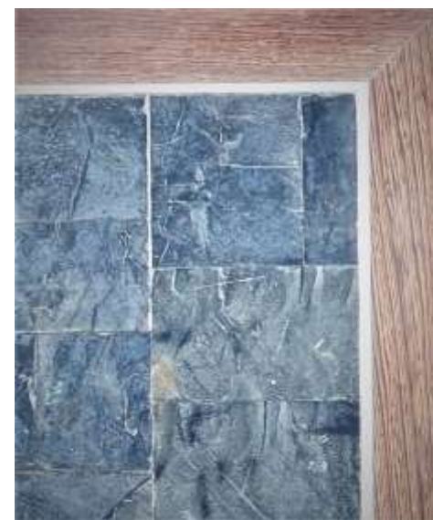
EVA - Table basse - Mica Wengé Bronze nickelé filet étain - 49 x 50 x 50 Création Jérôme Cordié 2014